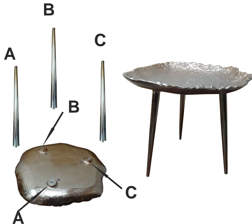
Стол журнальный арт. 71PN-1400

В процессе сборки необходима регулировка ножек по высоте для придания столу стабильности и устойчивости Порядок сборки: - переверните столешницу и разместите ее на ровной поверхности. Вкрутите металлические ножки (А,В,С) в отверстия на столешнице как показано на рисунке - Отрегулируйте высоту ножек в процессе сборки таким образом, чтобы стол не качался